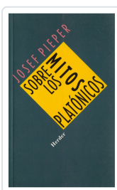
SOBRE LOS MITOS PLATONICOS PIEPER, JOSEF