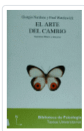
ARTE DEL CAMBIO, EL WATZLAWICK, PAUL