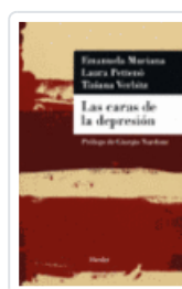
CARAS DE LA DEPRESION, LAS MURIANA, EMANUELA