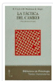
TACTICA DEL CAMBIO, LA FISCH, RICHARD