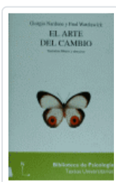
ARTE DEL CAMBIO, EL WATZLAWICK, PAUL