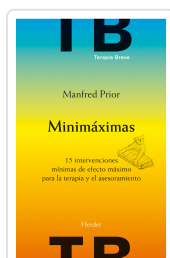
MINIMAXIMAS PRIOR, MANFRED