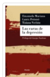
CARAS DE LA DEPRESION, LAS MURIANA, EMANUELA