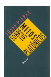
SOBRE LOS MITOS PLATONICOS PIEPER, JOSEF