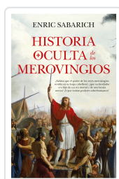
Historia oculta de los merovingios Enric Sabarich