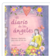
DIARIO DE LOS ANGELES, EL LAMPERT, VANESSA