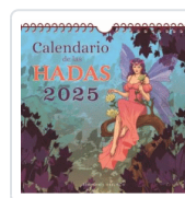
CALENDARIO DE LAS HADAS 2025 AA.VV.