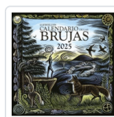
CALENDARIO DE LAS BRUJAS 2025 LLEWELLYN