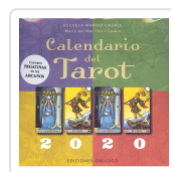
CALENDARIO DEL TAROT 2020 ESCUELA MARILO CASALS / TORT I CASALS