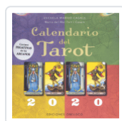
CALENDARIO DEL TAROT 2020 ESCUELA MARILO CASALS / TORT I CASALS