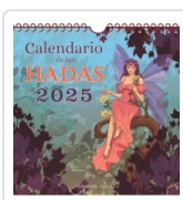
CALENDARIO DE LAS HADAS 2025 AA.VV.