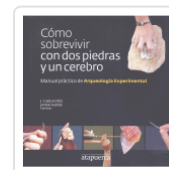
COMO SOBREVIVIR CON DOS PIEDRAS Y UN CEREBRO DIEZ / NASTRI