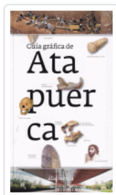
GUIA GRAFICA DE ATAPUERCA AA.VV.