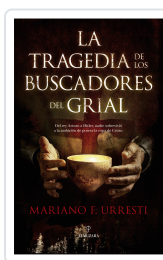
LA TRAGEDIA DE LOS BUSCADORES DEL GRIAL Mariano F. Urresti