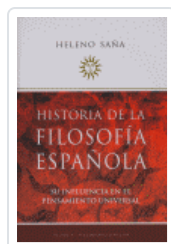
HISTORIA FILOSOFÍA ESPAÑOLA SÁÑA, HELENO