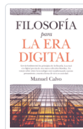
FILOSOFÍA PARA LA ERA DIGITAL CALVO, MANUEL