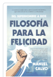
FILOSOFIA PARA LA FELICIDAD DEL SUPERHOMBRE A DIOS CALVO JIMENEZ, MANUEL