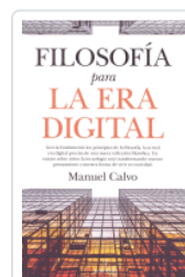
FILOSOFIA PARA LA ERA DIGITAL CALVO, MANUEL