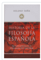
HISTORIA FILOSOFIA ESPAÑOLA SANA, HELENO